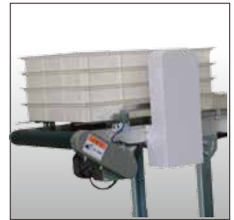
拆垛单元 段ばらしユニット Separator Unit