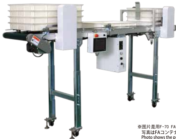
※图片是用F-70 FA物料箱时的排列机。 写真はFAコンテナF-70仕様機です。 Photo shows the product with F-40 specification FA container.